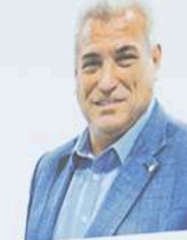
Kiss Ernő Magyar Napelem Nap- Szövetség